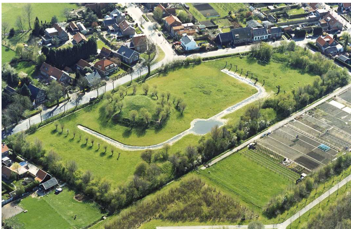
Afbeelding 2 De vliedberg 'Berg van Troje' aan de rand van het dorp Borsele uit de lucht.

Afgezien van de genoemde Romeinse vindplaatsen bestaat de archeologische kennis uit Borsele dus bijna geheel uit 'jonge' archeologische resten uit de bovenste laag van het bodemarchief (paragraaf 4.1: 'Laag 1'). Er is dus sprake van een grote kennislacune voor wat betreft de prehistorische bewoning in Borsele. Sporen daarvan kunnen in principe wel worden verwacht, maar - zoals hierboven al werd aangegeven – zijn op grotere diepte aanwezig en mogelijk goed geconserveerd. Hierdoor, en omdat de ruimtelijke ontwikkelingsdruk relatief laag is, is de informatiewaarde van dit deel van het bodemarchief naar verwachting niet wezenlijk aangetast – waarbij wel wordt opgemerkt dat het bodemarchief op sommige plaatsen door moertering kan zijn verstoord (zie Deel B, kaartbijlage 9-1; zie ook afbeelding 1).