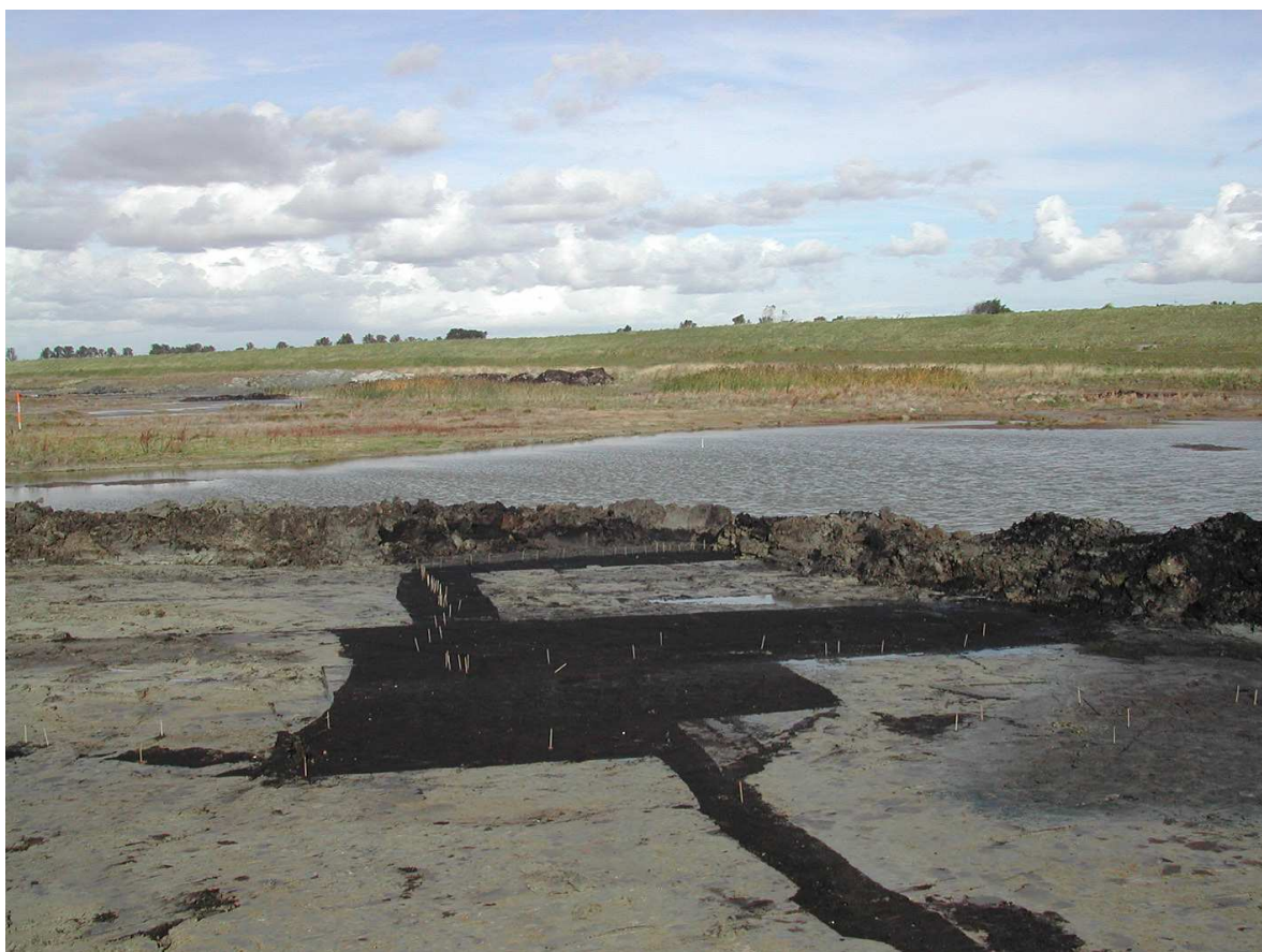
Afbeelding 1 De vindplaats uit de Romeinse tijd te Ellewoutsdijk in het veen met periode door de laat-middeleeuwse veenwinning (nu klei). Op de foto zijn delen van een huisplattegrond en een heining zichtbaar. De veenwinning vond plaats tot aan de wanden van het huis. In het veen, de bruine delen, zijn de aangetroffen sporen met stokjes aangegeven.

Hiermee is het ruimtelijk beleid van Borsele ingebed in het Integraal Omgevingsbeleid (IOB) van de provincie Zeeland, het gedachtegoed van de nota Belvedere en de Nota Ruimte op rijksniveau (o.a. wat betreft het Nationaal Landschap Zuidwest Zeeland, waarvan Borsele deel uitmaakt). Archeologie, ofwel de zorg voor het ondergronds bodemarchief, wordt in genoemde gemeentelijke documenten weinig genoemd. Toch tonen zij dat er in Borsele draagvlak bestaat voor zaken als behoud en versterking van de cultuurhistorische erfenis (zowel boven- als ondergronds; afbeelding 1 ). De wettelijke zorgplicht voor het bodemarchief kan in het bestaande beleid dus naadloos worden ingepast. In het volgende hoofdstuk wordt aangegeven welk ambitieniveau de gemeente Borsele daarbij kiest.