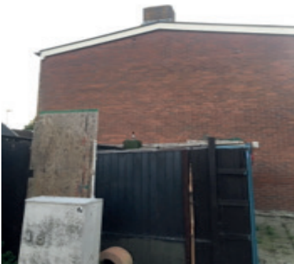
Woning in Prinses Margrietstraat

Zoals u in onze vorige nieuwsbrief heeft kunnen lezen zijn we bezig met een natuuronderzoek. Dit moeten we doen om in kaart te brengen of, en zo ja waar, eventueel beschermde diersoorten aanwezig zijn. Inmiddels hebben we een aantal onderzoeken uit laten voeren door Buijs Eco Consult (BEC). Zij zijn nu bezig met het aanvullend onderzoek. Zij doen dit ook 's nachts en 's ochtends heel vroeg. Dit gebeurt in de Prinses Margrietstraat voor het in beeld brengen van de nestlocaties van de huismus en de paarverblijven van de gewone en ruige dwergvleermuis.