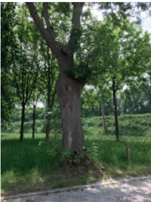
Boom met holte in het Dorpsbos

De onderzoeken worden uitgevoerd in overeenstemming met de richtlijnen opgesteld voor de uitvoering van veldwerk met betrekking tot vleermuisinventarisaties en -monitoring i.v.m. corona.